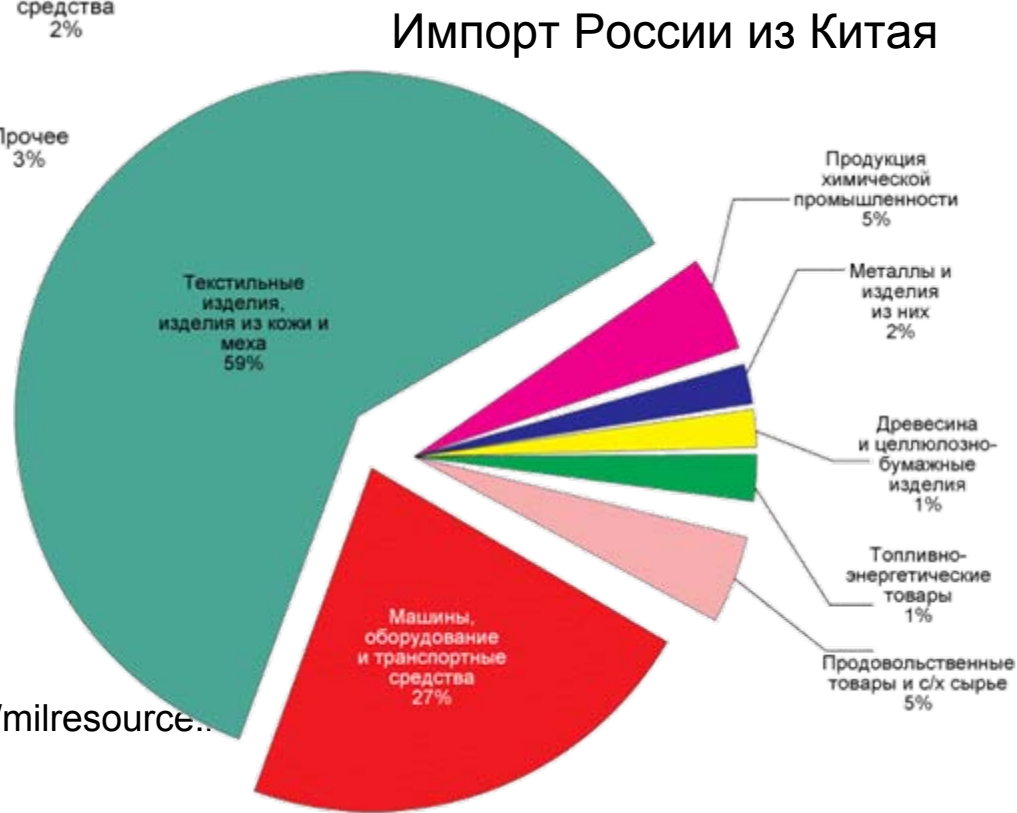
Импорт России из Китая