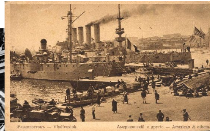
Владивостокъ — Vladivostok.